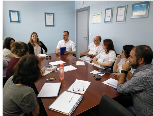
Reunión con las asociaciones de autismo de Córdoba y Jaén