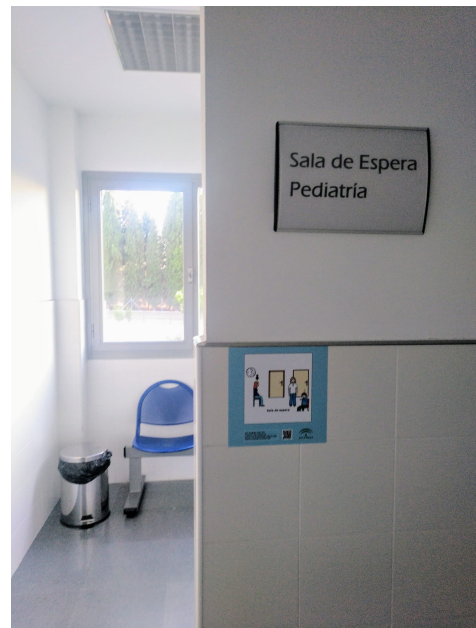
Señalización con pictogramas en el Hospital de Montilla.