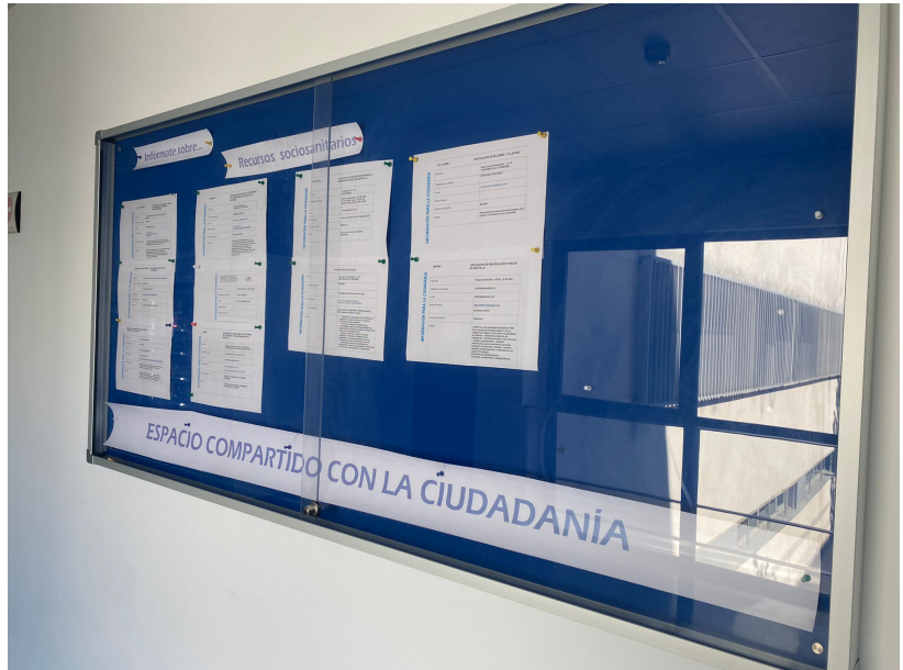
Área con materiales informativos y de comunicación a personas con diversidad funcional. Exposición permanente y panel con los recursos socio-sanitarios de la zona.